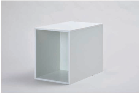
S + Cube(大)