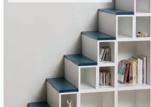
ドレスアップも可能

段数奇数・偶数により、組み合わせ方が異なります。S + Cube（小）の数が違うため、見た目のイメージも変わります。